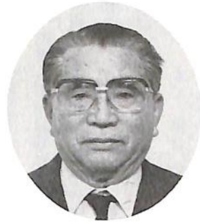
中央大学学員会副会長