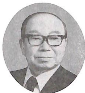
中央大学学生会会長