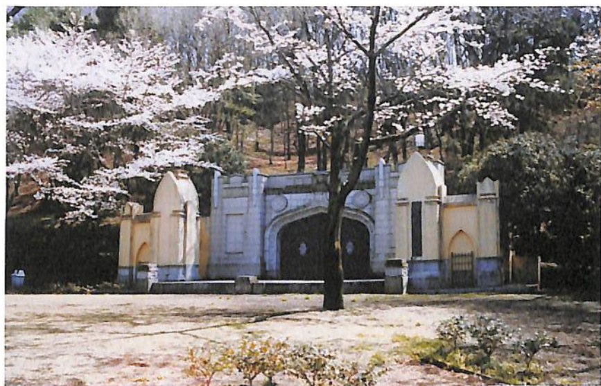
多摩キャンパス 旧白門