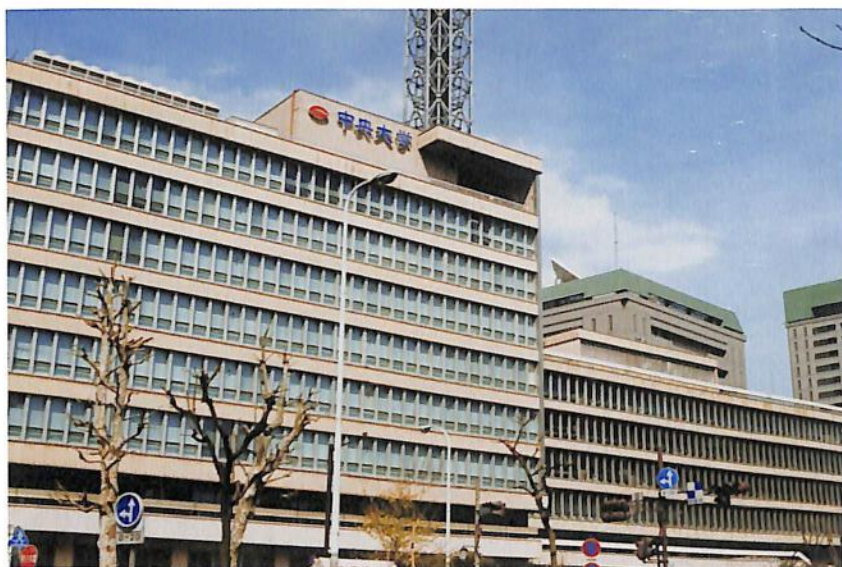
市ヶ谷キャンパス