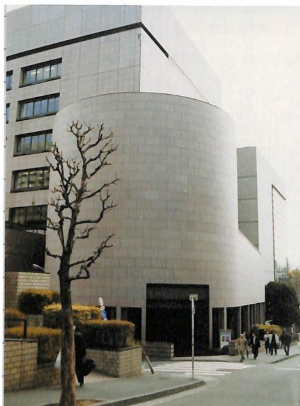
神田駿河台 中央大学記念館