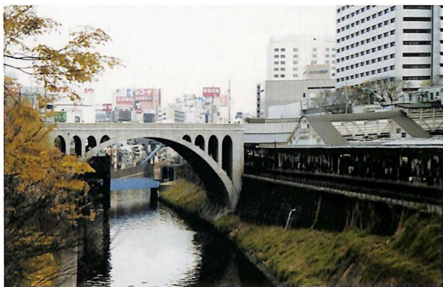
お茶の水駅と聖橋