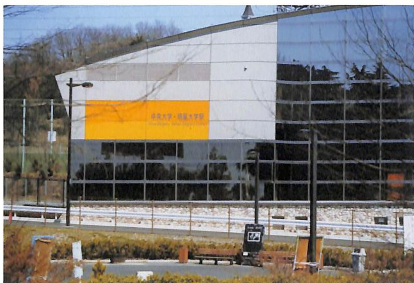
多摩キャンパス多摩モノレール駅