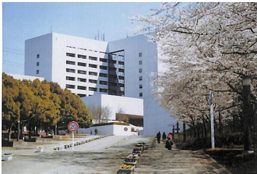
多摩キャンパス正門付近