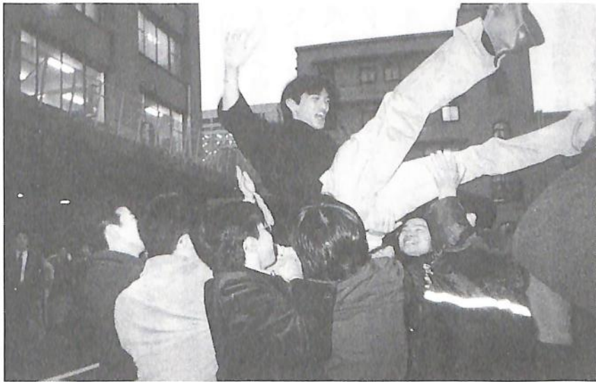
平成12年度司法試験合格発表

時間がまいりましたので、本日は、この辺で終わりたいと思います。お忙しい中、協力ありがとうございました。