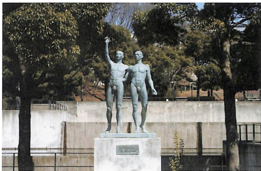
多摩キャンパス 青年像