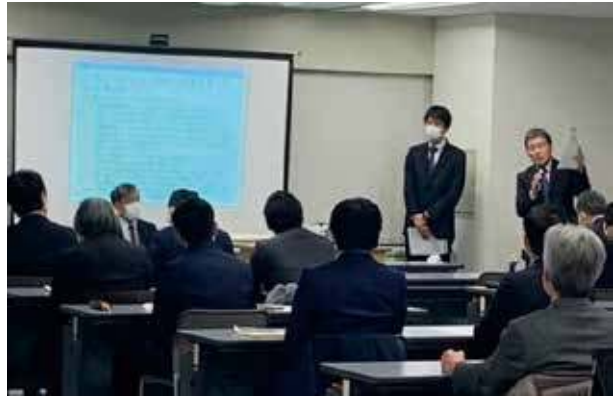
2023年1月23日開催・ 公認会計士白門会との交流会 (講演会)