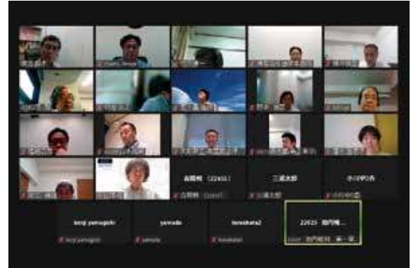
2022年8月10日開催・ 令和4年度第1回常任幹事会・拡大幹事会 (WEB開催)