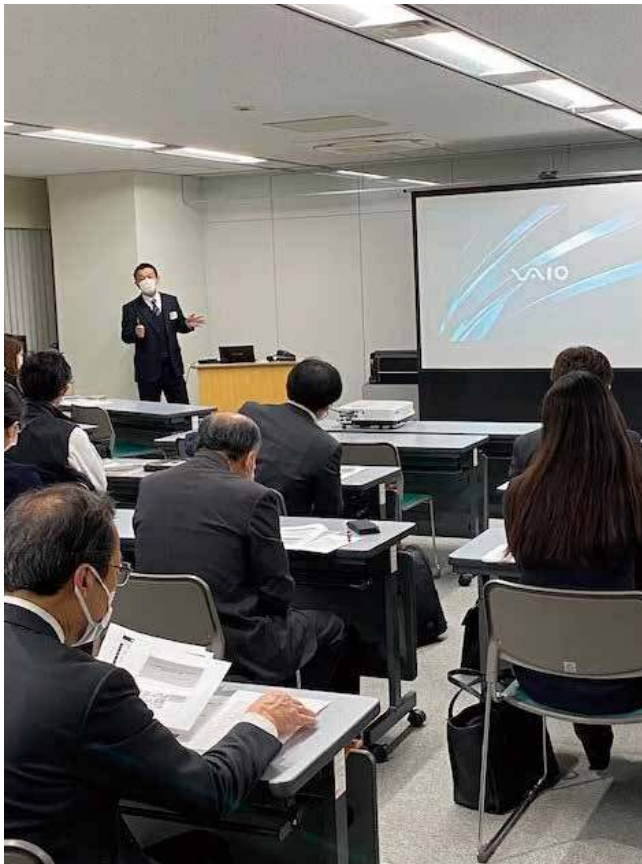
2022年11月9日開催・ 社会保険労務士白門会との交流会 (勉強会)