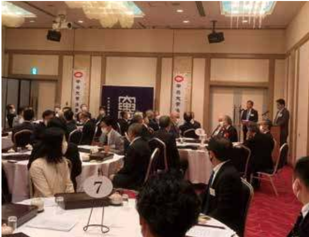
2022年5月27日開催・令和3年度第4回常任幹事会・ 拡大幹事会及び令和4年度定時総会