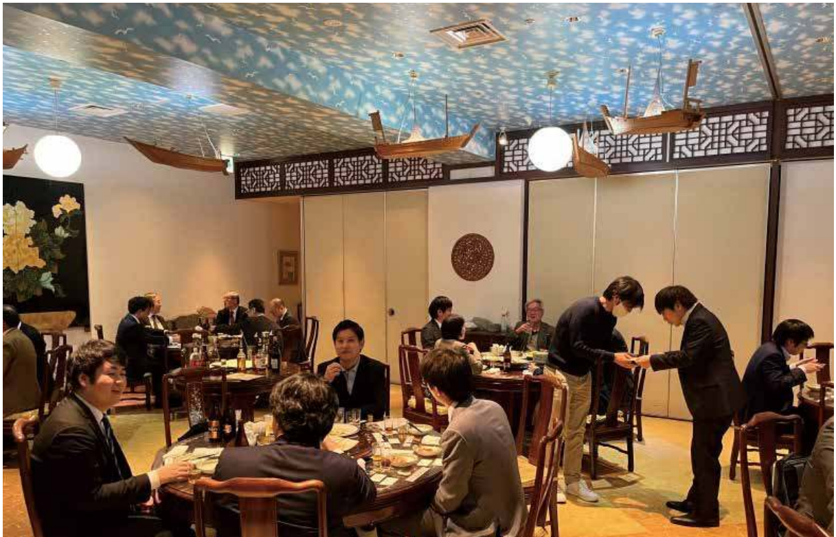
2023年1月23日開催・公認会計士白門会との交流会 (懇親会)