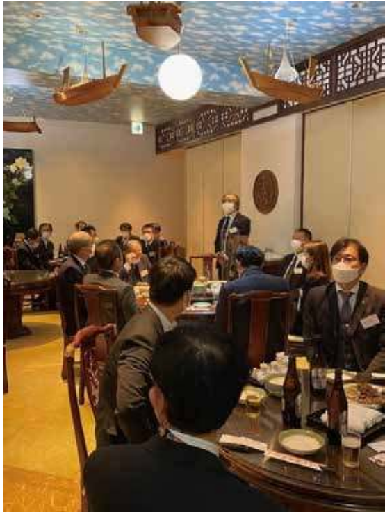
2022年11月9日開催・ 社会保険労務士白門会との交流会 (懇親会)