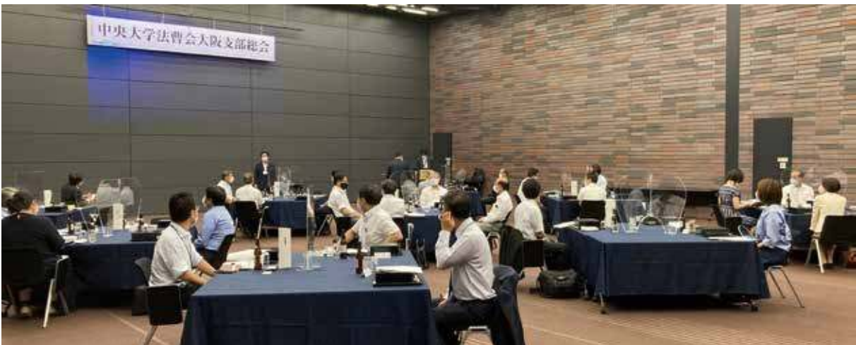
2021年7月26日開催・大阪支部総会・懇親会