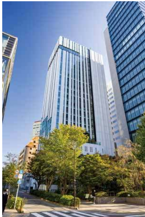
2023年2月に竣工した駿河台キャンパス