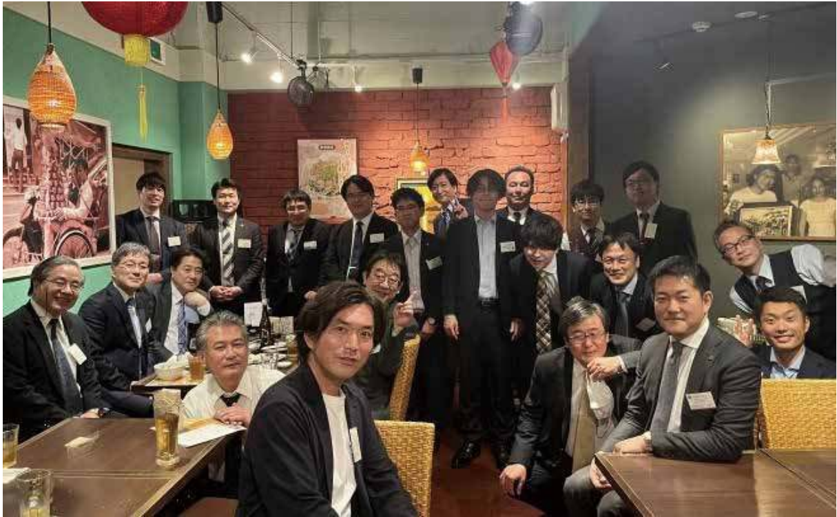
2022年3月31日開催・行政書士白門会との交流会