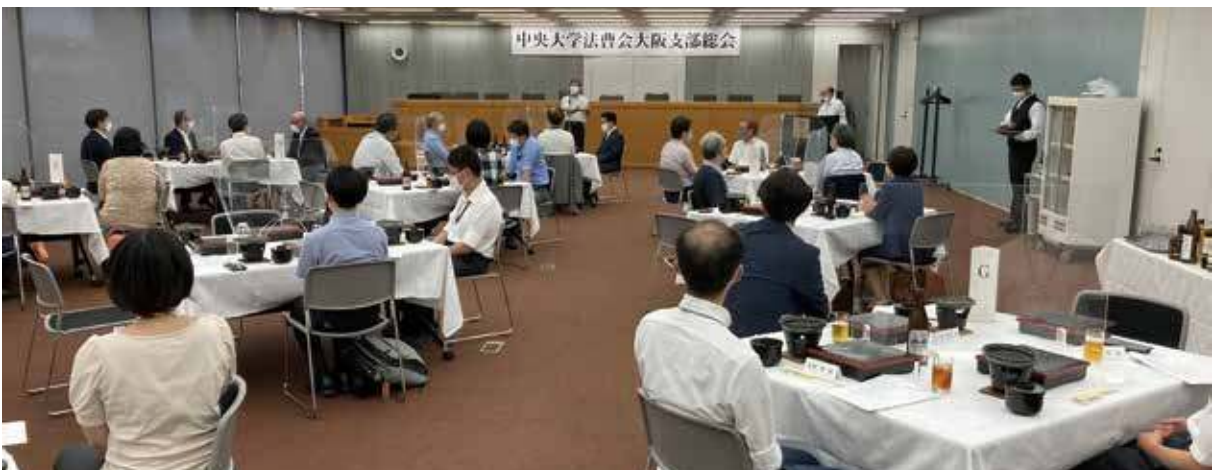
2022年7月25日開催・大阪支部総会・懇親会