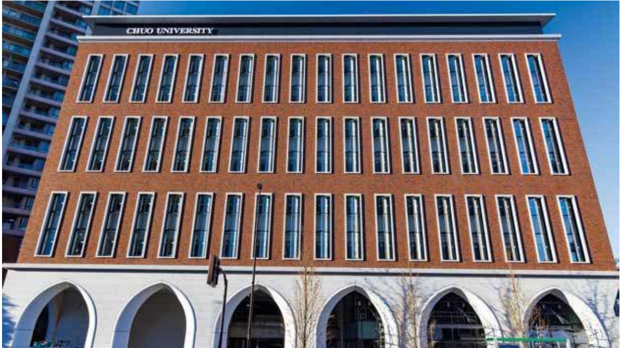
2023年1月に竣工した茗荷谷キャンパス