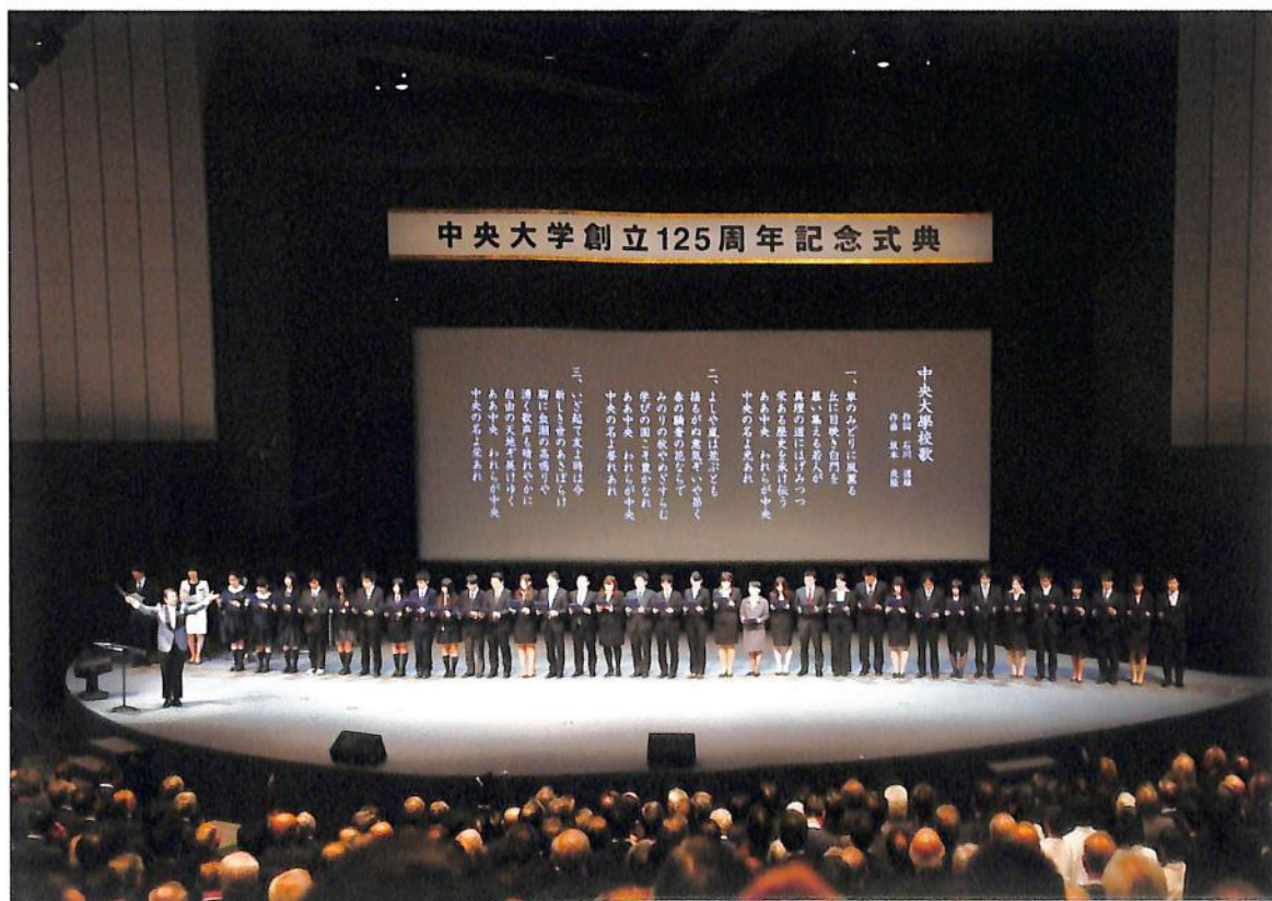
【中央大学創立125周年記念式典（平成22年11月13日）】