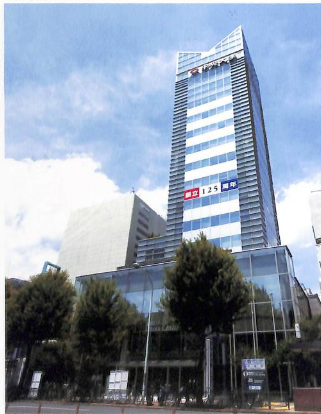
【中央大学創立125周年を祝う、多摩校舎と田町校舎】