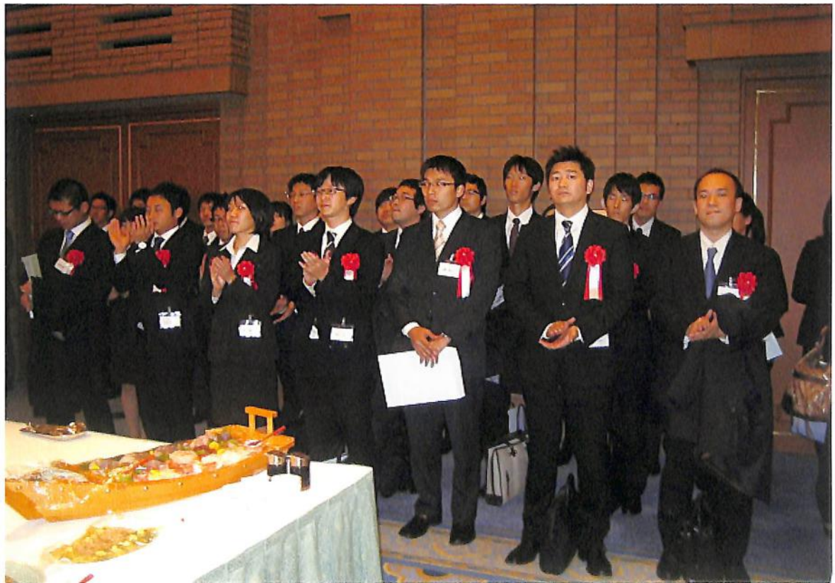
【平成22年度中央大学司法試験合格者祝賀会（同年11月28日）、才口千晴元最高裁判事】