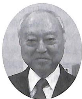
中央大学法曹会・顧問